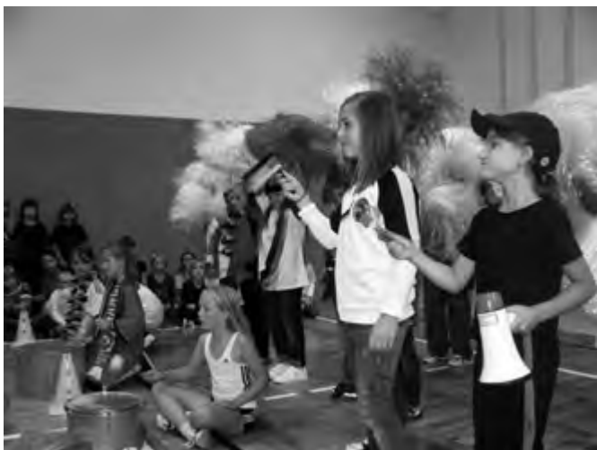
Programm zur Einweihung der Turnhalle

Besonderer Höhepunkt war die offizielle Eröffnung der renovierten Turnhalle, zu der die zahlreich erschienenen Gäste ein von den Schülern liebevoll vorgetragenes kulturelles Rahmenprogramm mit Tanz, Gesang, Gedichtsvorträgen sowie einer kleinen Märchenaufführung mit „Hase und Igel“ erleben durften. Auch wenn die Arbeiten im Außenbereich der Turnhalle noch nicht ganz abgeschlossen waren, war doch für jeden deutlich erkennbar, dass unsere Kinder jetzt nahezu ideale Bedingungen für ihre Sport- und Freizeit-Aktivitäten vorfinden.