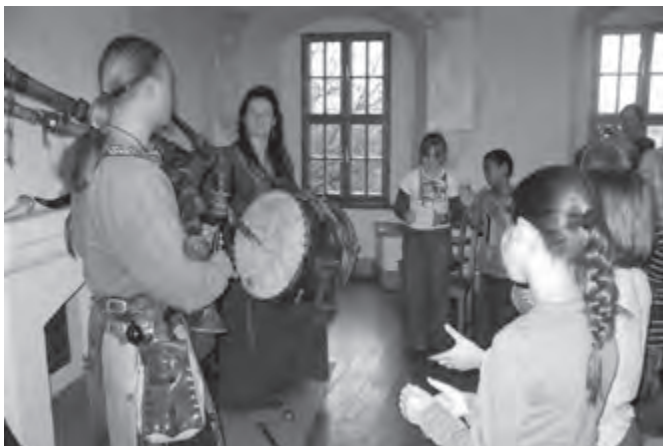
Ausflug auf die Burg Wolkenstein