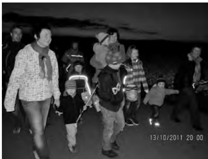
Endlich ging es los!