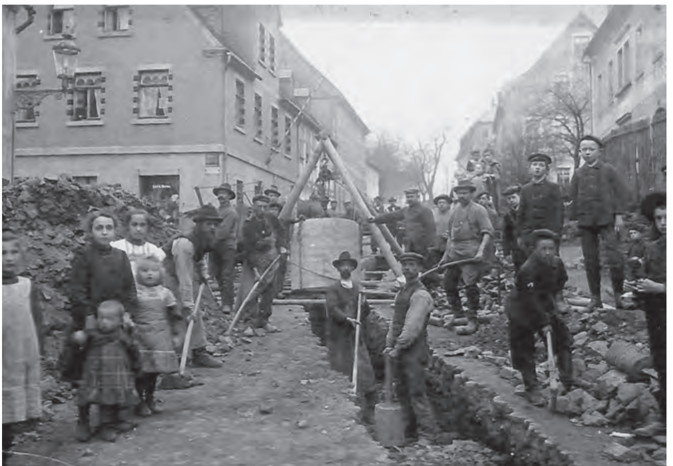
Das historische Foto

Thomas Weise Schloßplatz 5 · 09429 Wolkenstein